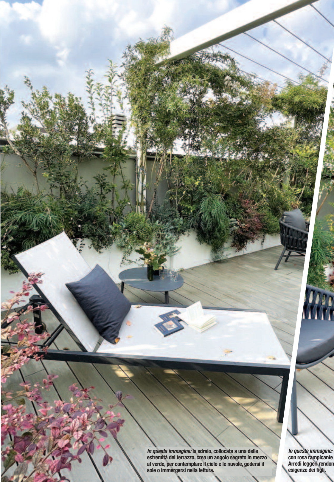
In questa immagine: la sdraio, collocata a una delle estremità del terrazzo, crea un angolo segreto in mezzo al verde, per contemplare il cielo e le nuvole, godersi il sole o immergersi nella lettura.