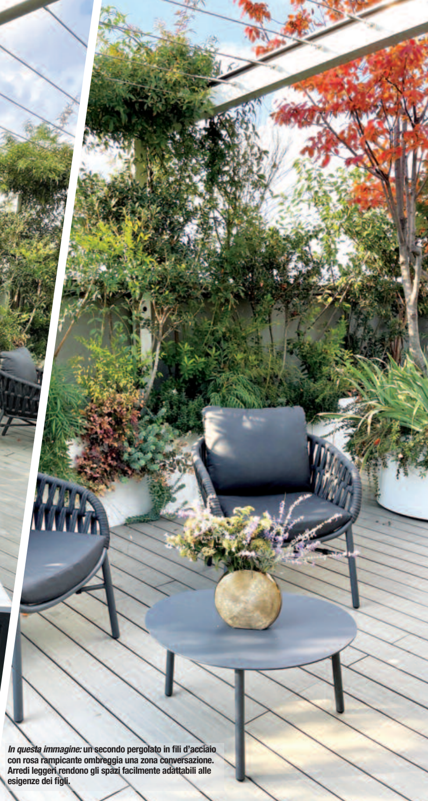
In questa immagine: un secondo pergolato in fili d'acciaio con rosa rampicante ombreggia una zona conversazione. Arredi leggeri rendono gli spazi facilmente adattabili alle esigenze dei figli.