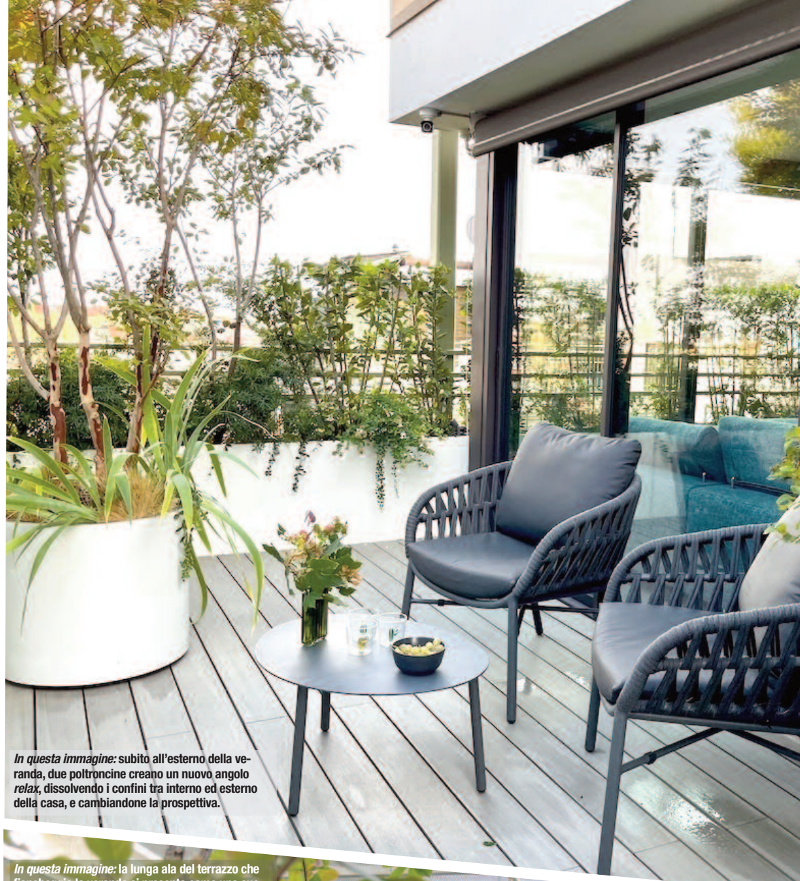
In questa immagine: subito all'esterno della veranda, due poltroncine creano un nuovo angolo relax, dissolvendo i confini tra interno ed esterno della casa, e cambiandone la prospettiva.