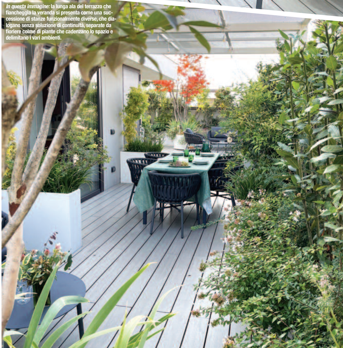
In questa immagine: la lunga ala del terrazzo che fiancheggia la veranda si presenta come una successione di stanze funzionalmente diverse, che dialogano senza soluzione di continuità, separate da fioriere colme di piante che cadenzano lo spazio e delimitano i vari ambienti.