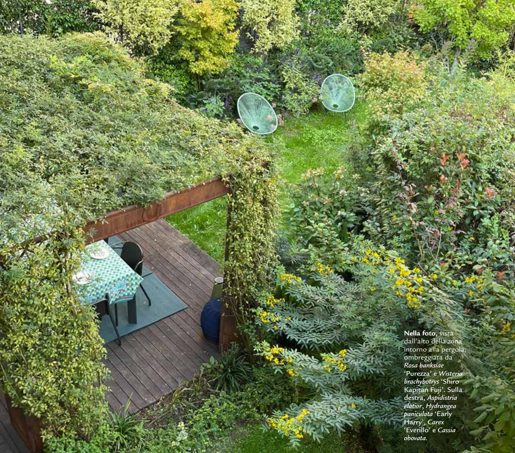
Nella foto, vista dall'alto della zona intorno alla pergola, ombreggiata da Rosa banksiae 'Purezza' e Wisteria brachybotrys 'Shiro Kapitan Fuji'. Sulla destra, Aspidistria elatior , Hydrangea paniculata 'Early Harry', Carex 'Everillo' e Cassia obovata .